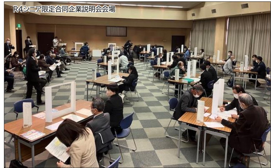
R4シニア限定合同企業説明会会場

・開催アンケート調査では、 企業・団体 1社あたり平均 3.5人の シニア世代とお仕事について直接会話いただける機会となりました。