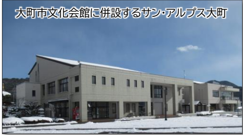
大町市文化会館に併設するサン・アルプス大町

・生涯現役事業開始以降、4回目となるシニア世代限定合同企業説明会をサン・アルプス大町にて開催いたしました。