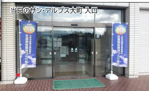
R6シニア限定合同企業説明会会場の様子